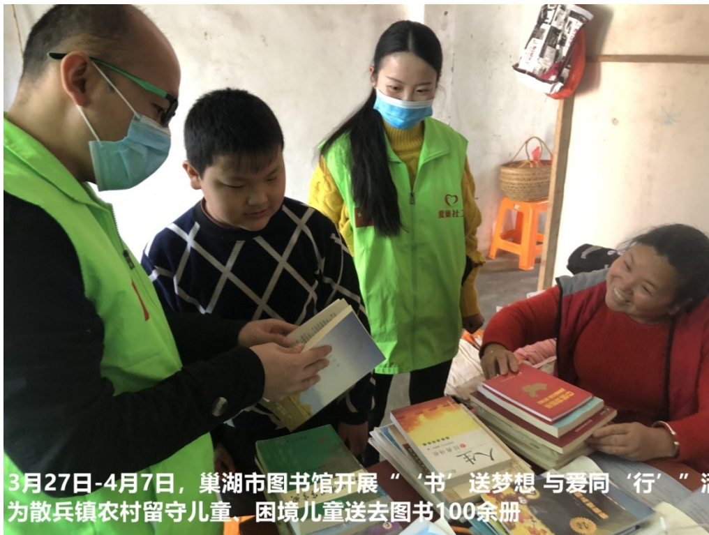
“书”送梦想 与爱“童”行