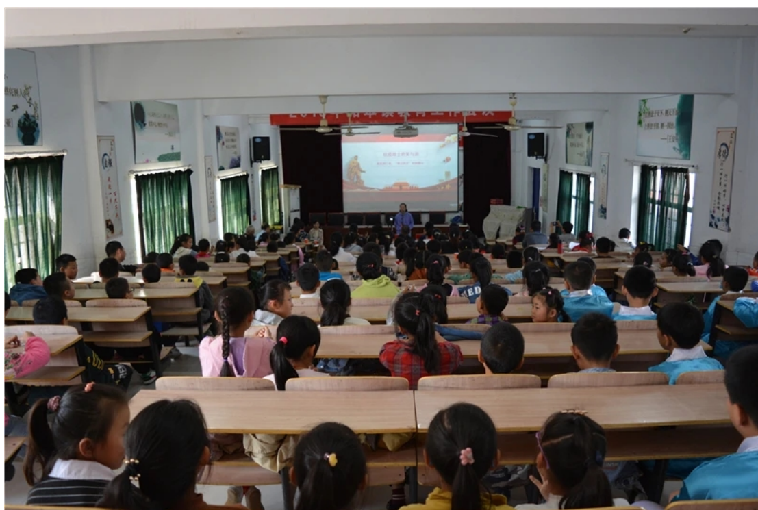
中小學生“中華美文誦讀大賽”活動