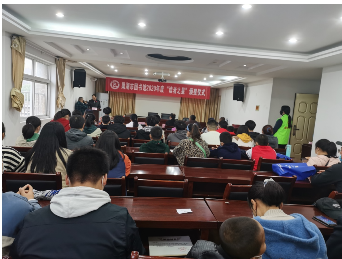
读者之星评选活动