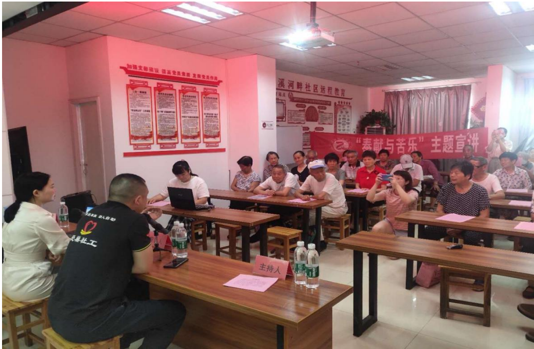
“奉献与苦乐”志愿实践主题活动