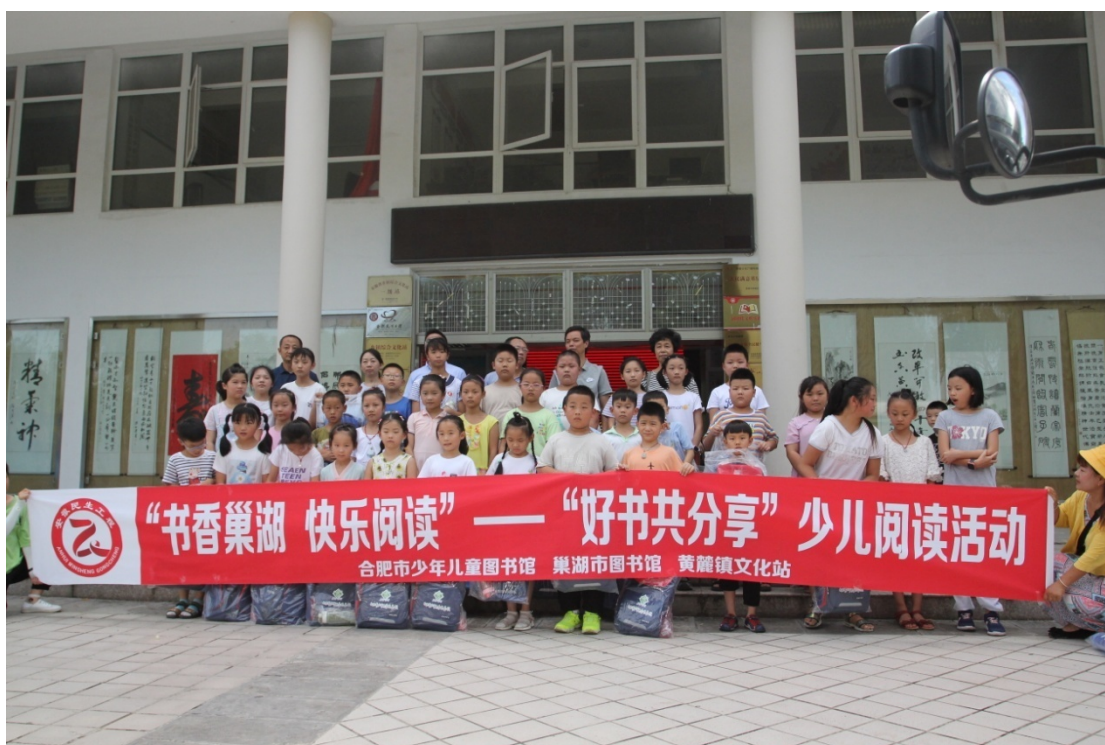
读者之星评选活动