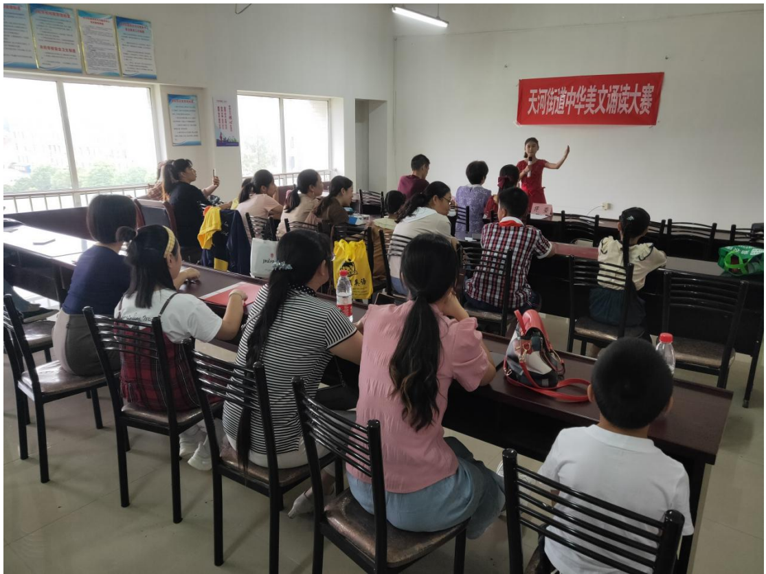
举办“中华美文诵读大赛”活动