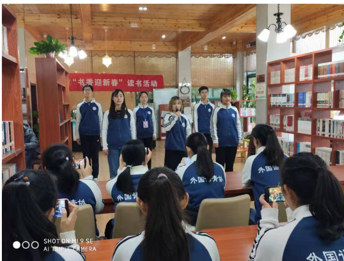
书香迎新春读书活动