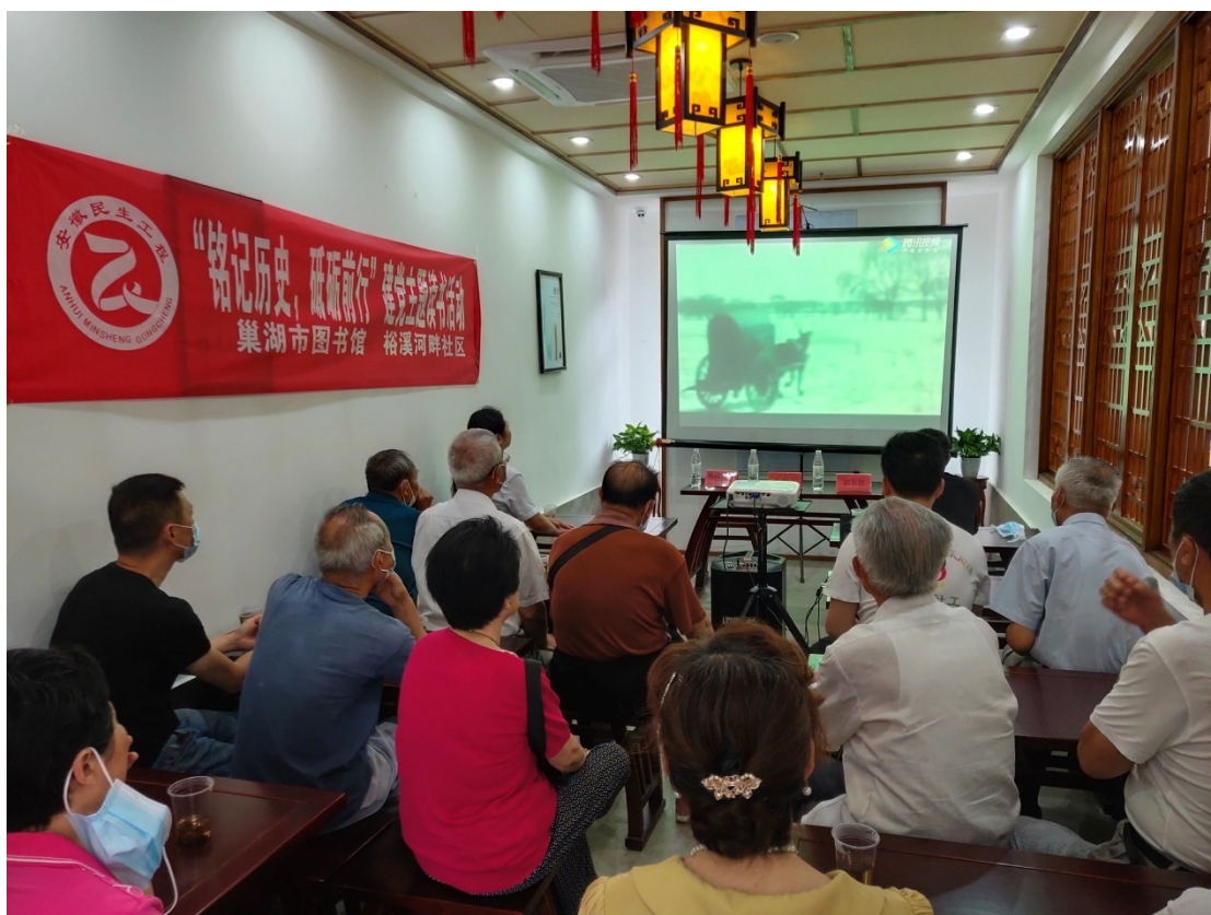
铭记历史，砥砺前行建党主题读书活动