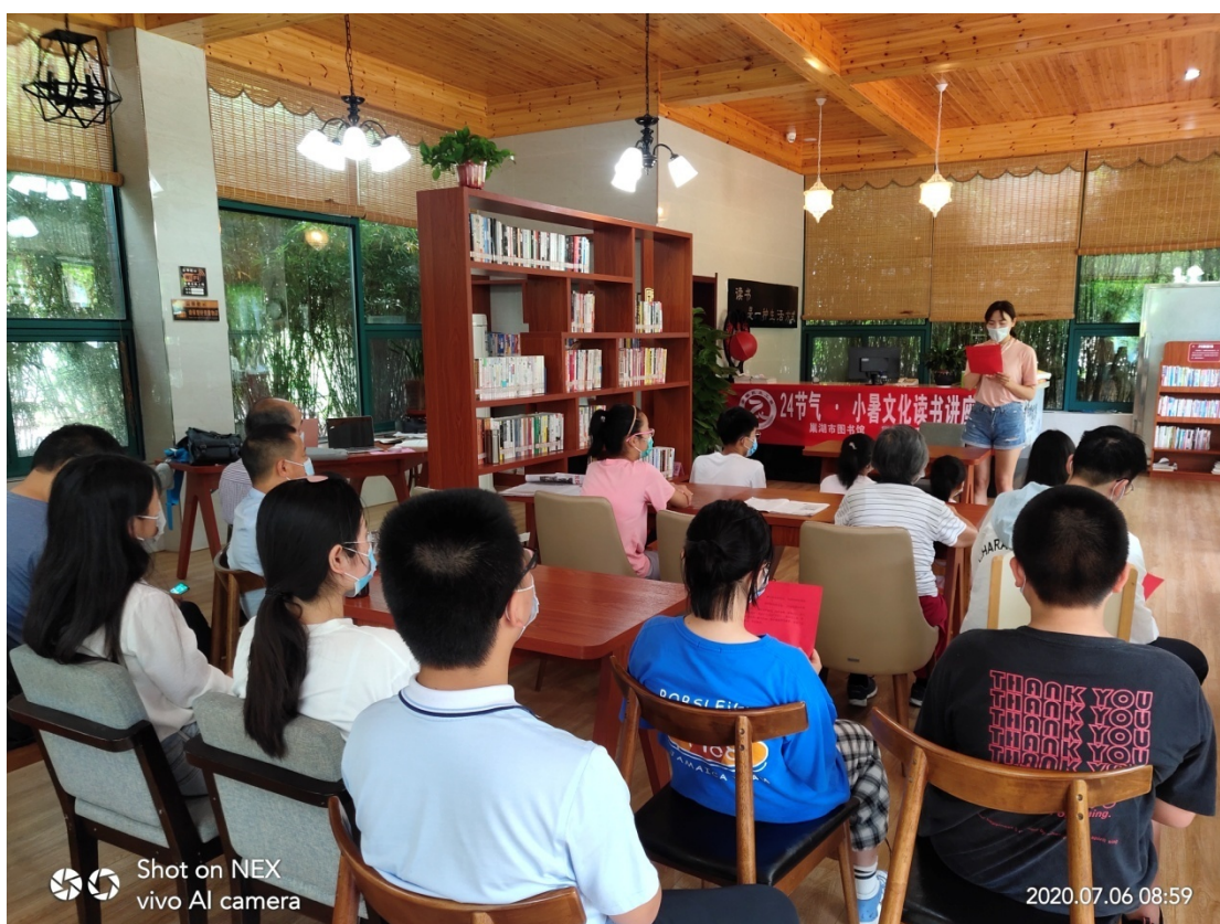
小暑读书讲座活动