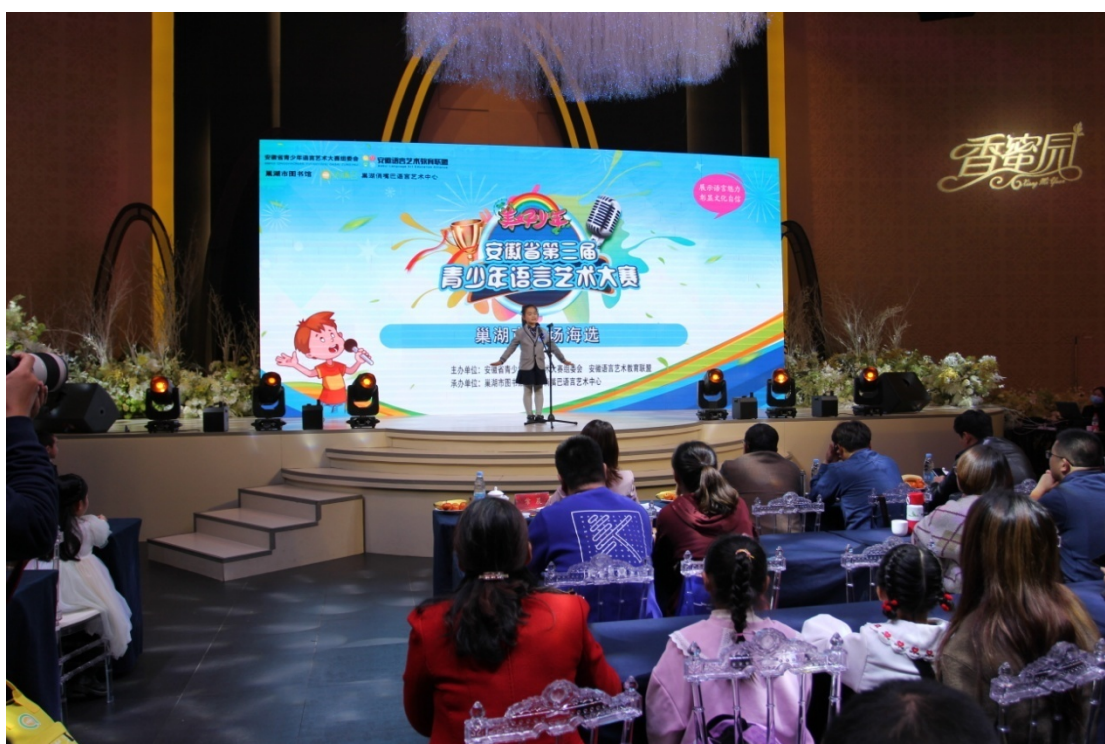
青少年语言艺术大赛活动活动