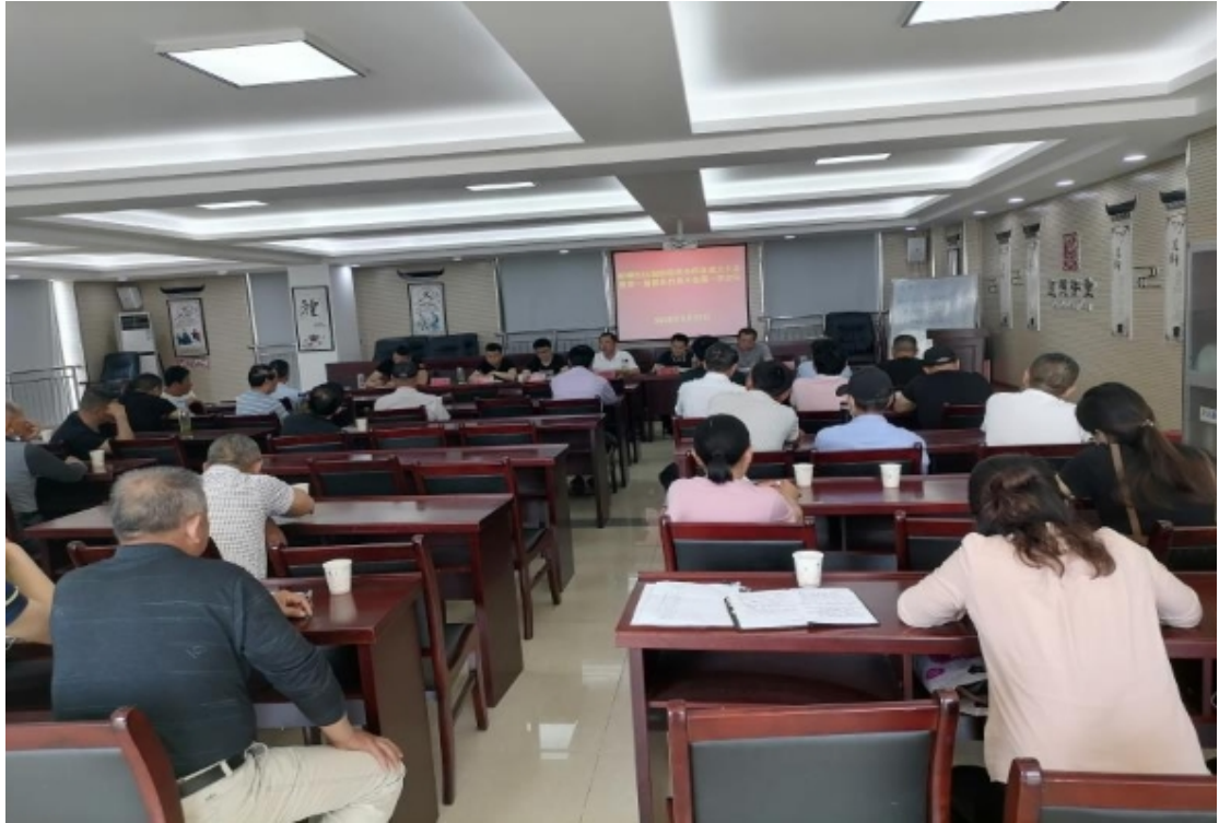
读者安全防范教育宣传活动