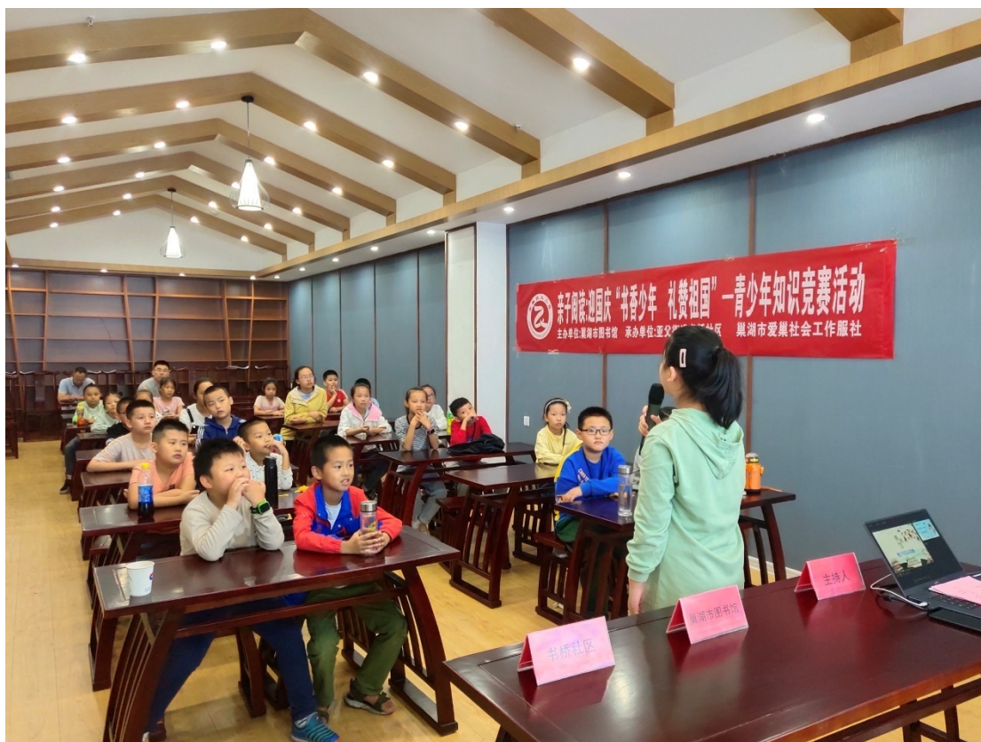
“书香少年 礼赞祖国” 青少年知识竞赛活动