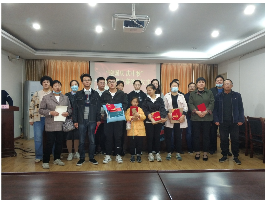
“迎国庆 庆中秋知识竞答比赛活动