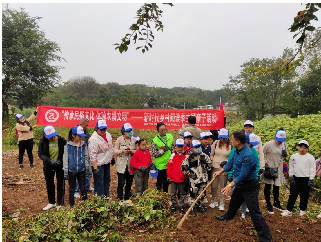
新时代乡村阅读季主题亲子活动