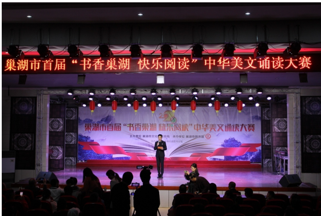
“中华美文诵读大赛”的活动