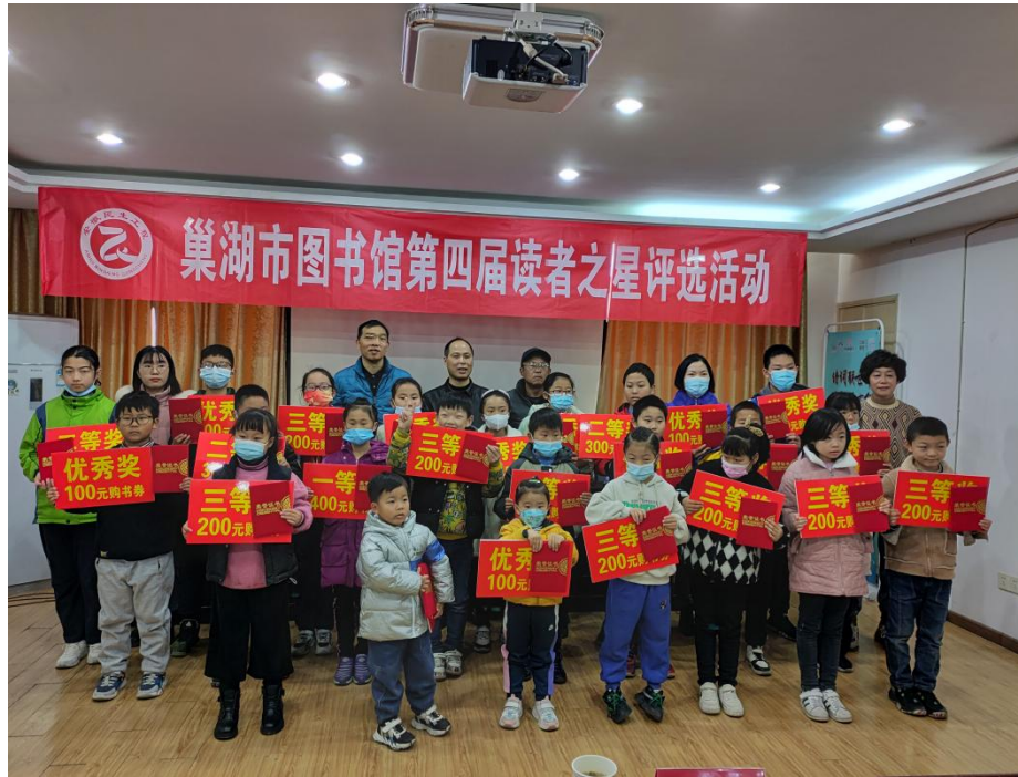
读者之星评选颁奖活动