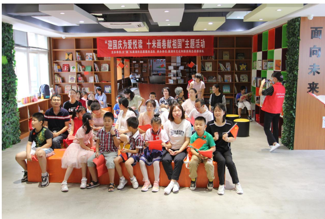
迎国庆为爱悦读 十米画卷献祖国