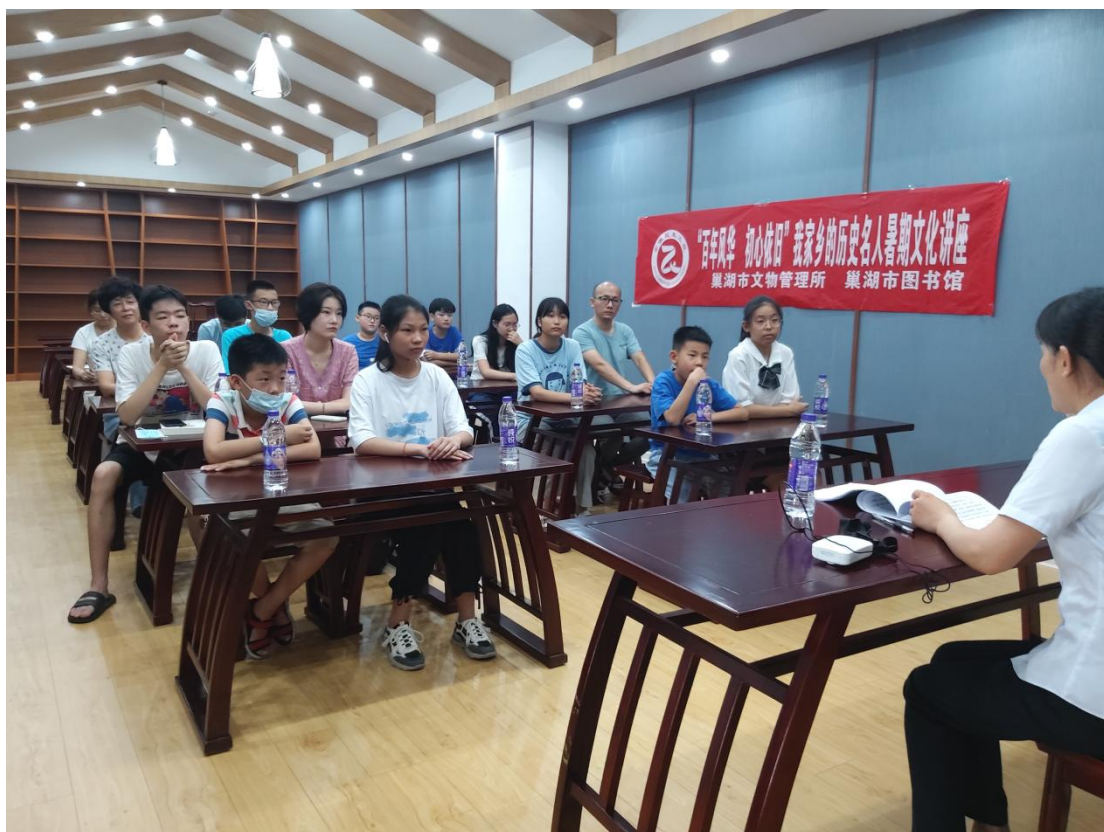
暑期文化讲座系列活动之《建国后的张治中》