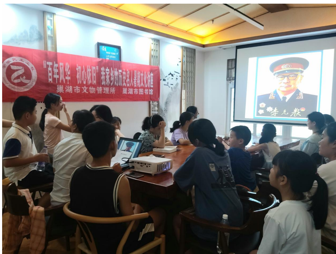
暑期文化讲座系列活动之《解放战争时期的李克农》