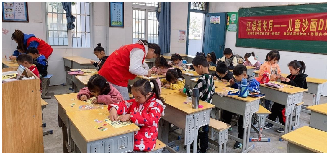
江淮读书月——儿童沙画DIY”活动