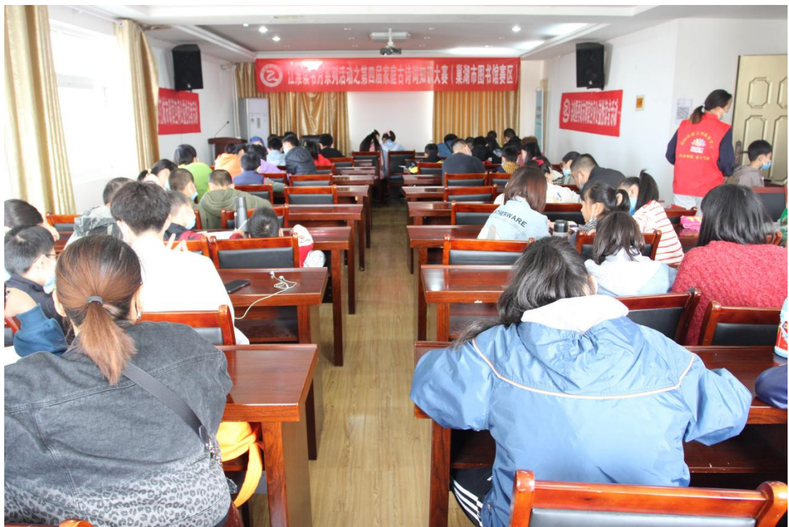
家庭古诗词大赛活动