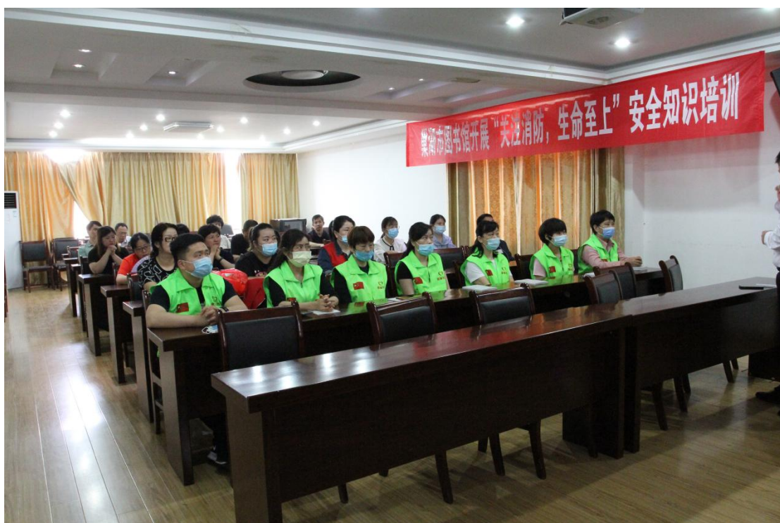
“关注消防，生命至上”安全知识培训讲座