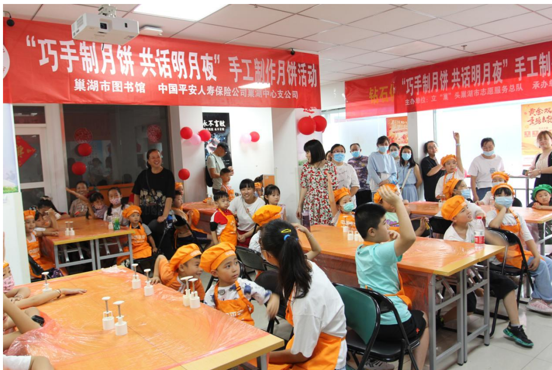
手制月饼 共话明月夜“手工月饼活动