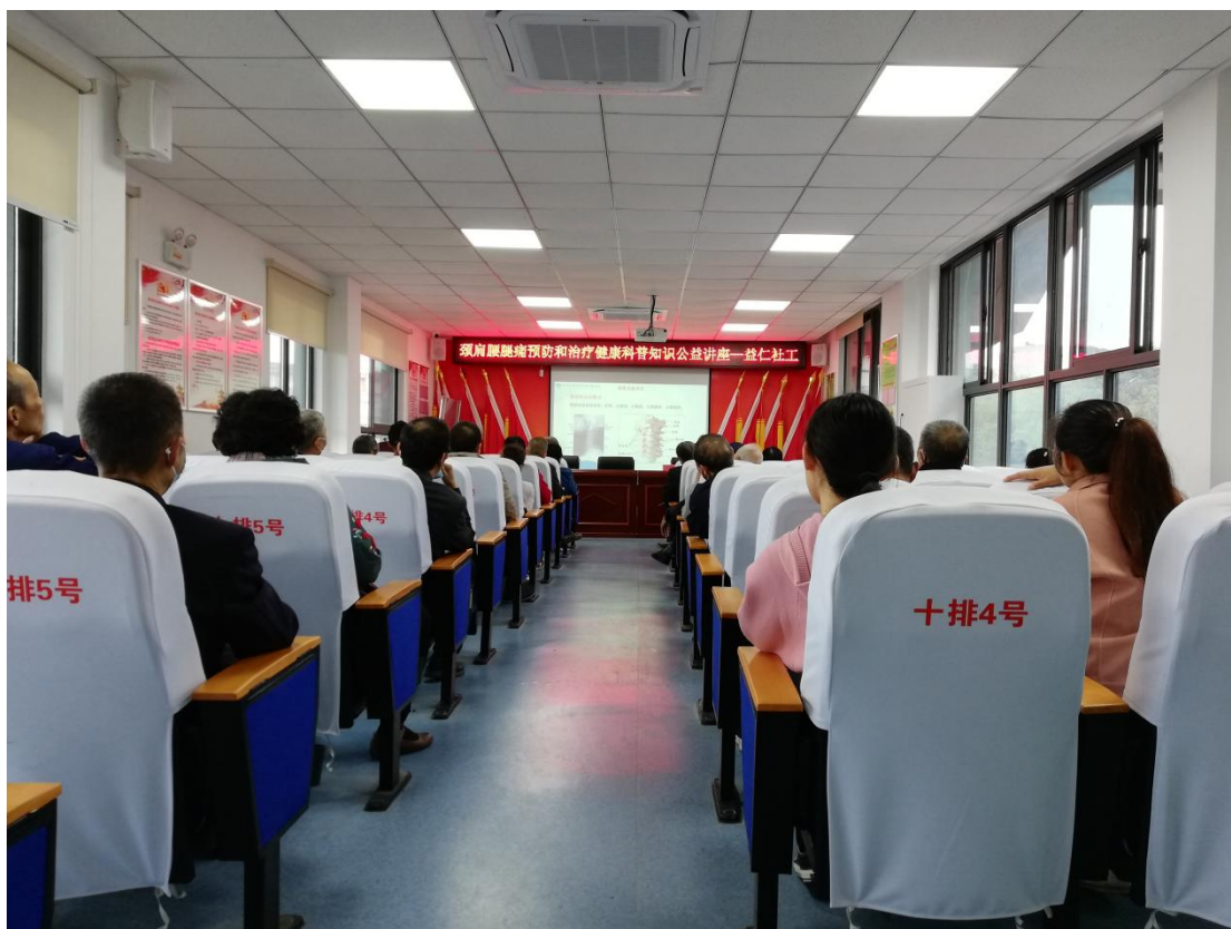
“书香巢湖 文化讲坛”颈肩腰腿痛预防和治疗