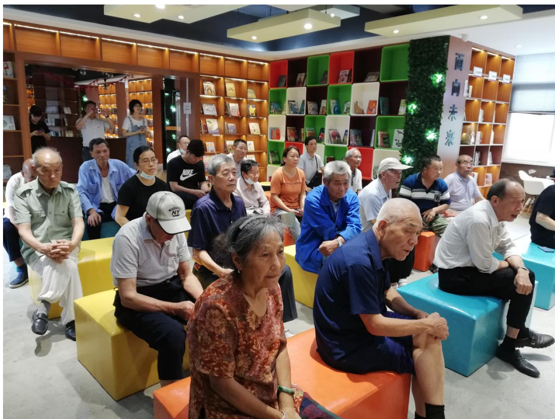
“文化讲坛 文化讲坛”——中国共产党的辉煌历程