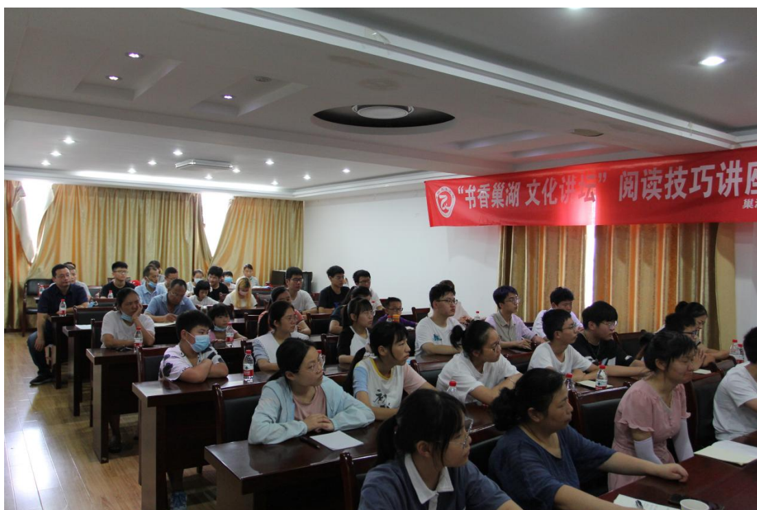
“书香巢湖 文化讲坛”回到阅读常识 文化讲坛方案