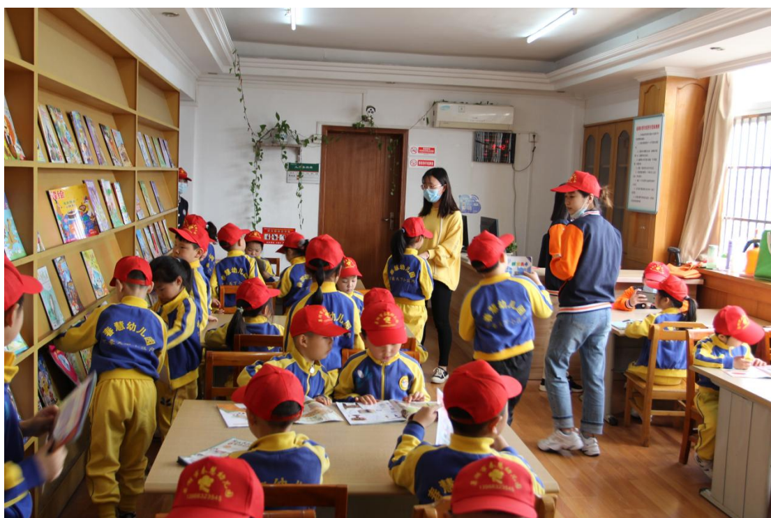
书香之旅,开启别样童年系列活动