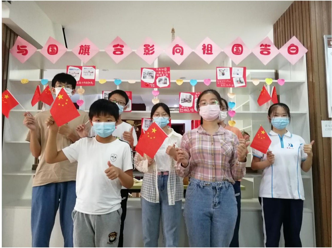
与国旗合影，向祖国告白