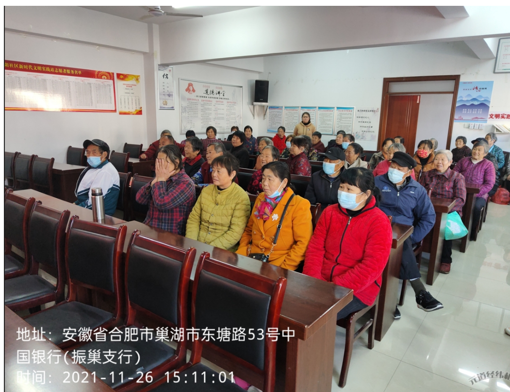
关爱老人，送健康”冬季养生健康知识讲座