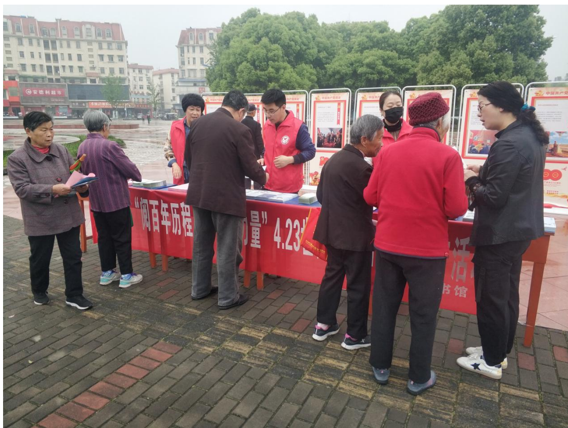
世界读书日宣传活动